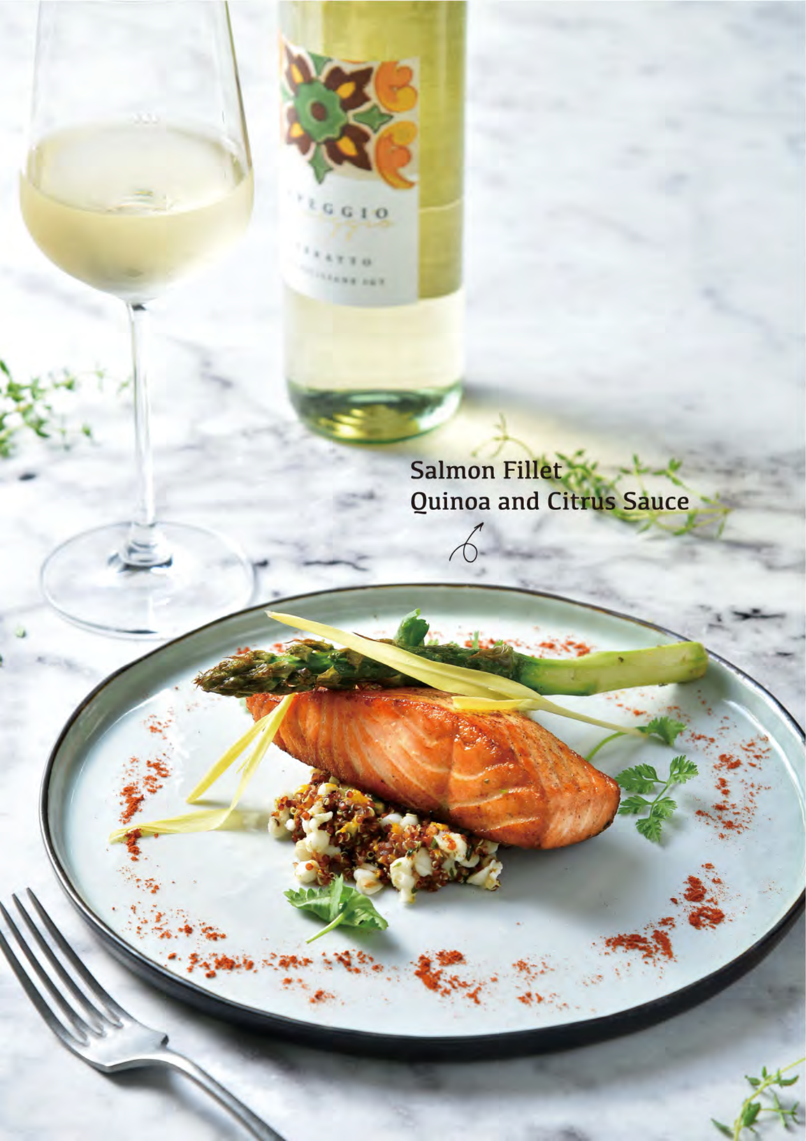
Salmon Fillet Quinoa and Citrus Sauce