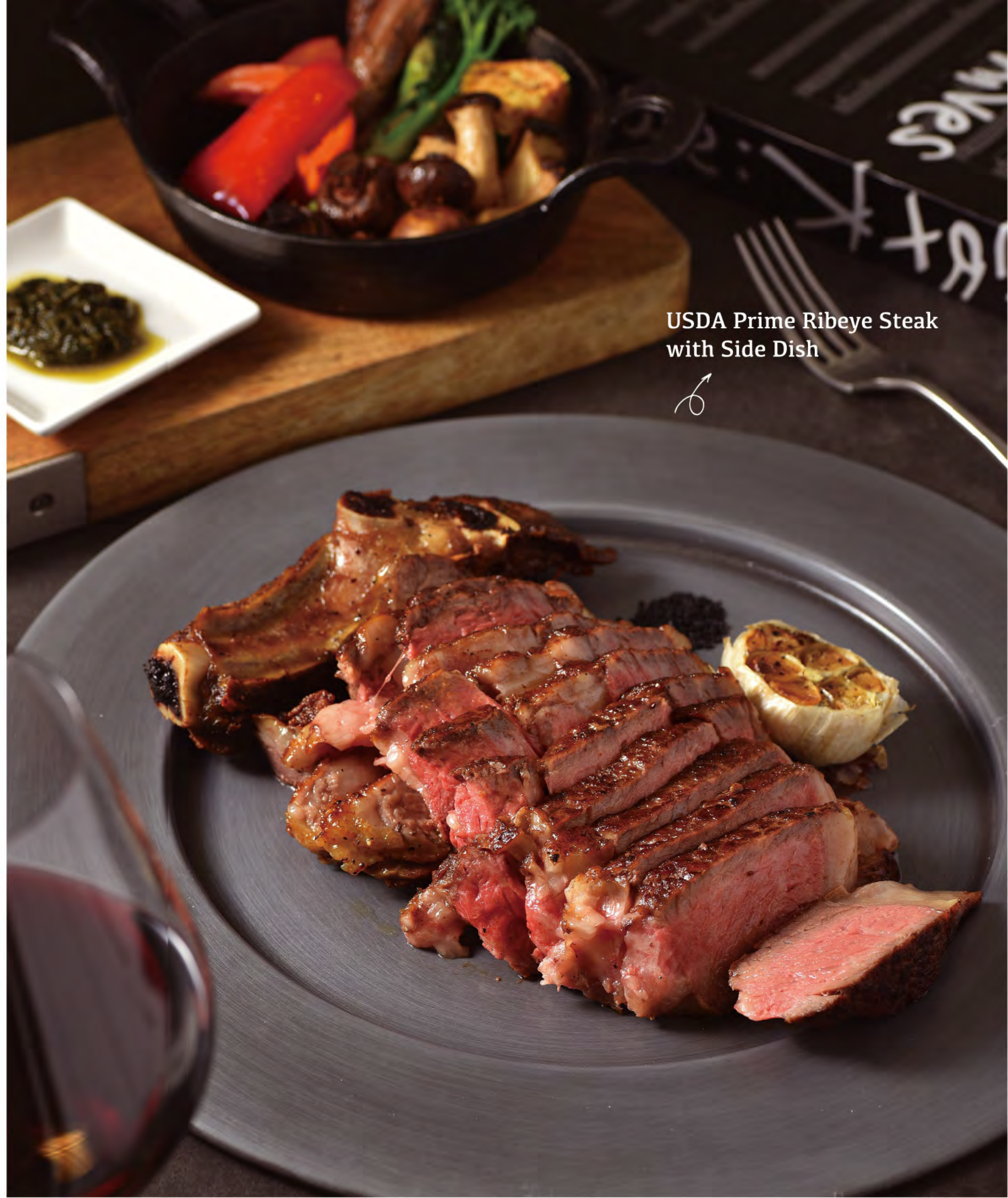
USDA Prime Ribeye Steak with Side Dish